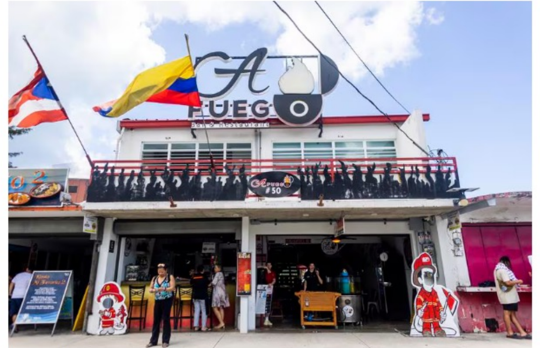
Kiosk #50 in this popular gastronomic area stands out for its unique concept featuring two floors: the first floor resembles a firetruck cabin, while the second floor has a beautiful terrace overlooking the sea.