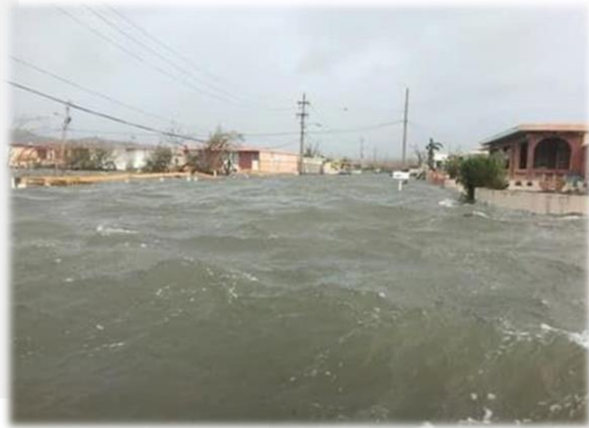
Punta Santiago, Humacao, Huracán María - Puerto Rico