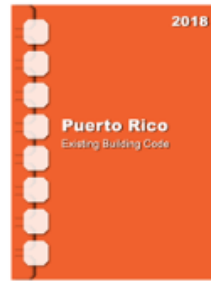
2018 Puerto Rico Existing Building Code