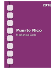
2018 Puerto Rico Mechanical Code