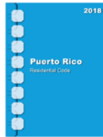
2018 Puerto Rico Residential Code