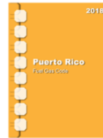
2018 Puerto Rico Fuel Gas Code