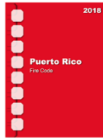
2018 Puerto Rico Fire Code