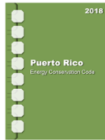
2018 Puerto Rico Energy Conservation Code