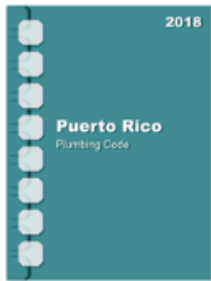
2018 Puerto Rico Plumbing Code