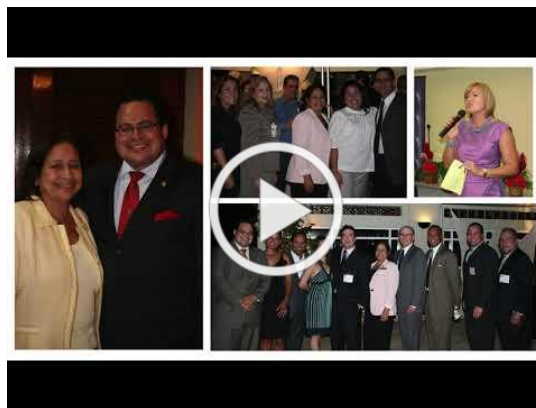
20 Aniversario de la RED de Empresarias y Mujeres Profesionales