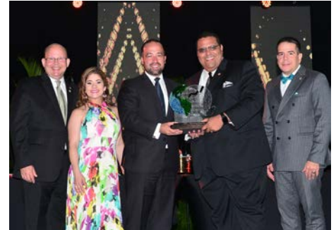
Entidad Gubernamental del Año COR3 - Oficina Central de Recuperación, Reconstrucción y Resiliencia