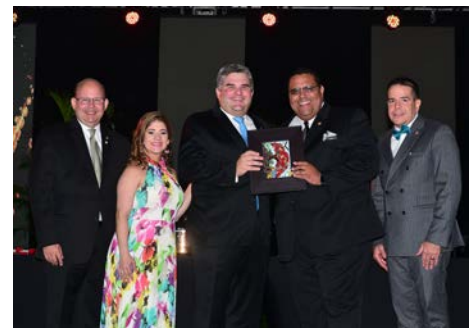
Premio Especial del Presidente Asociación de Constructores de Puerto Rico