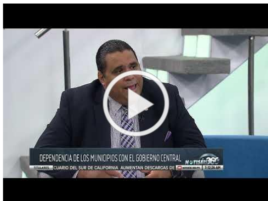
Análisis: Relación fiscal entre Municipios y el Gobierno Central

El jueves 30 de mayo el presidente Rivera Robles participó en el programa de No Seis 360 para hablar sobre abastos de inventarios y eliminación del impuesto al inventario.