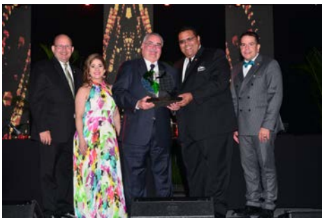
Institución del Año Fundación Kinesis