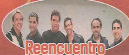
Reencuentro Los Ex-Menudos