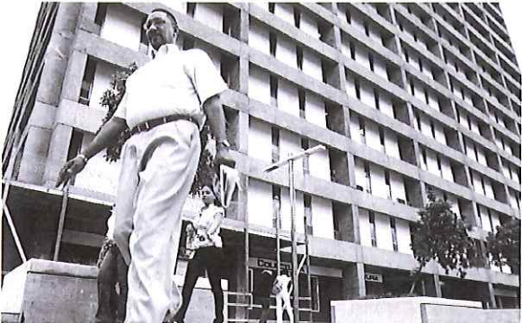
Municipios, agencias y corporaciones le deben al BGF $9,418 millones.

EL NUEVO DÍA Miércoles, 4 de febrero de 2015