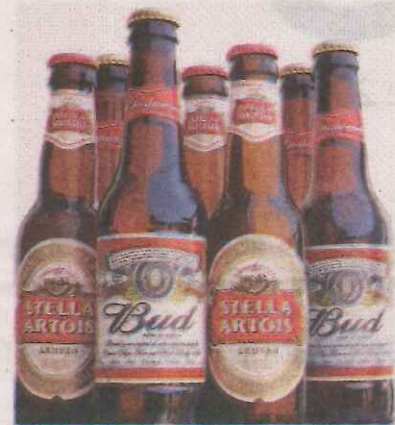
Cervezas de Anheuser-Busch.

La industria ha experimentado una época de consolidación, conforme los gustos de los consumidores se desplazan hacia la cerveza artesanal y el vino. AB InBev y SABMiller son producto de esta tendencia a fusionarse.