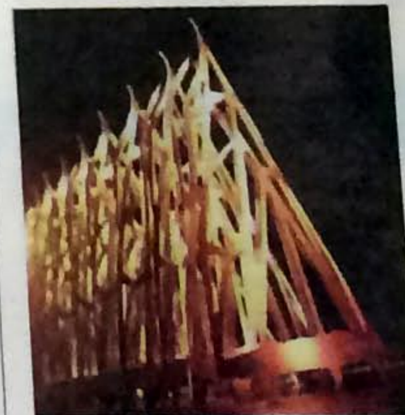
Anoche se entregaron 65 premios Cúspide a 11 agencias del patio.