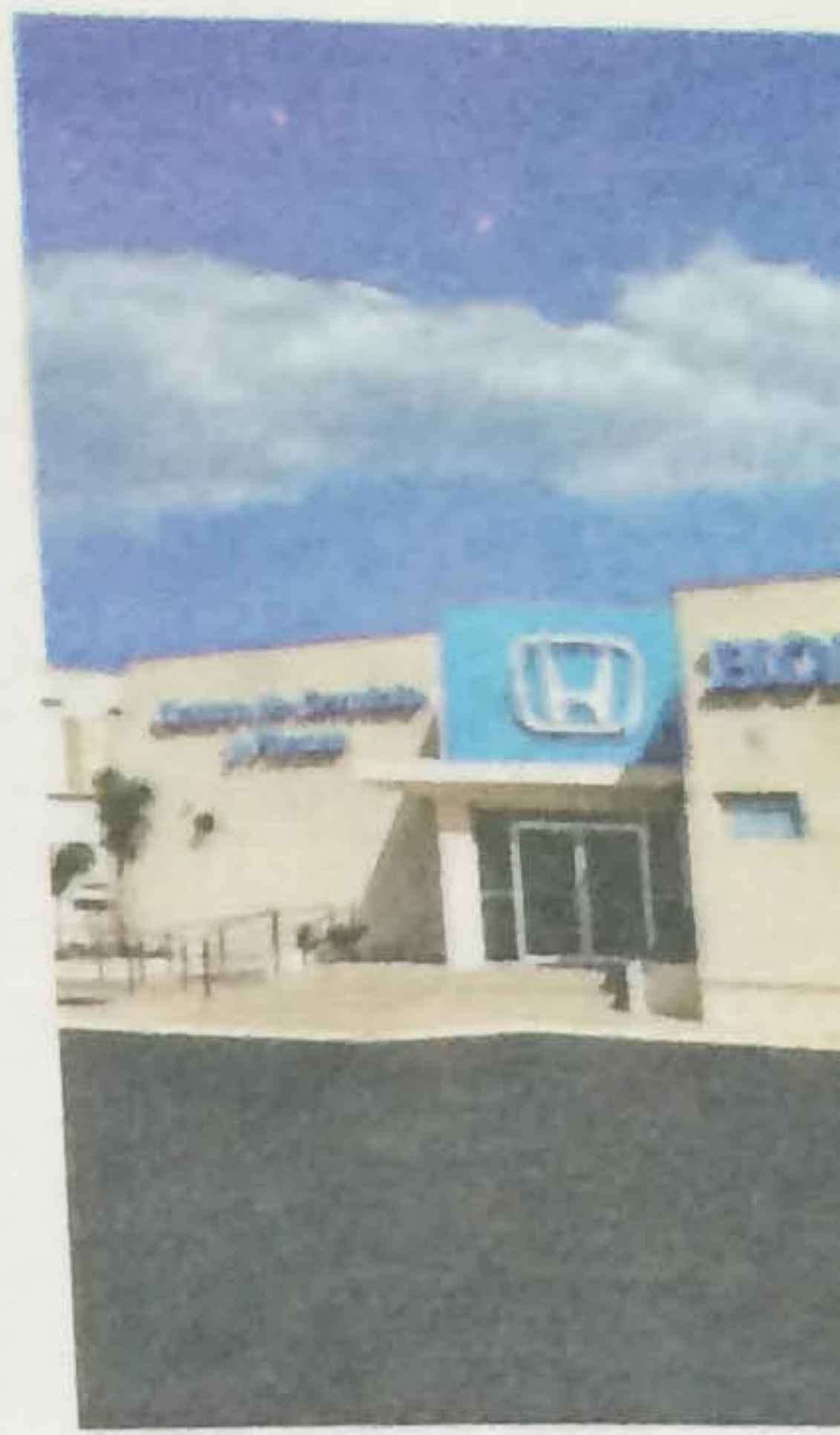
El centro de servicio de espera con computado

indicó también que en el centro de servicios de Honda en San Juan contempla equipos para, incluyendo techos que ayudan a proteger y conservar el ambiente mediante el uso