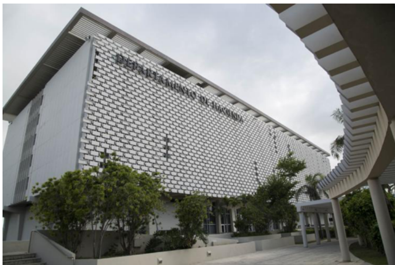
Josian E. Bruno Gómez / EL VOCERO

Ileanxis Vera Rosado, EL VOCERO 06/02/2019