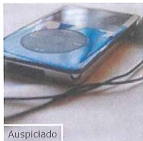
Auspiciado Las 20 canciones más intensas para ejercitarte (que quizás no conozcas) e-How