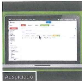
Auspiciado Como saber si un correo ha sido leído en Gmail. Yesware Gratis y Legal