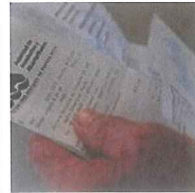
Más de 250 las querellas por cobro indebido de agua y luz