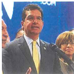
PNP repudia las medidas fiscales de la administración García Padilla