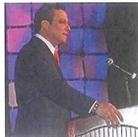
Gobernador asegura que buscó opción de menor impacto al consumidor