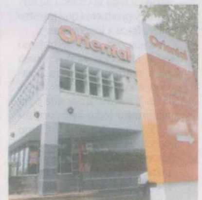
Oriental celebra sus 50 años.