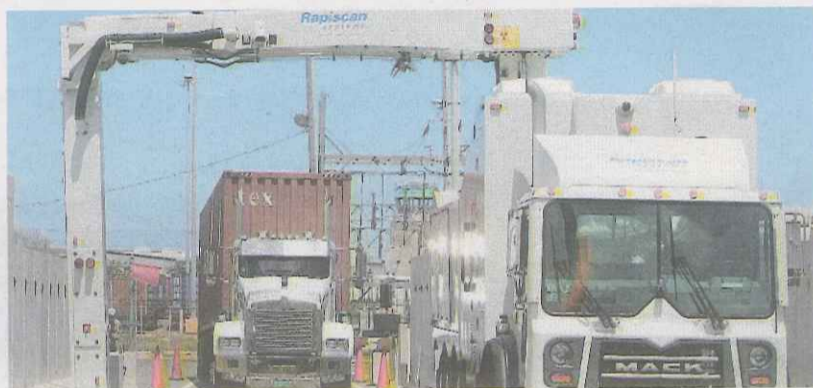
Un juez federal de distrito declaró que el cargo de $69 por escanear furgones no viola cláusulas de comercio interestatal ni afecta la industria.

La opinión de McGiverin indica que, tras escuchar la evidencia sometida, no pudo establecerse que el cargo, vigente desde octubre de 2011, viole el comercio interestatal o signifique un perjuicio económico a la industria. Sin embargo, aclaró que las cláusulas de comercio interestatal si se violan cuando se cobra el cargo y no se realiza el escaneo de los furgones.