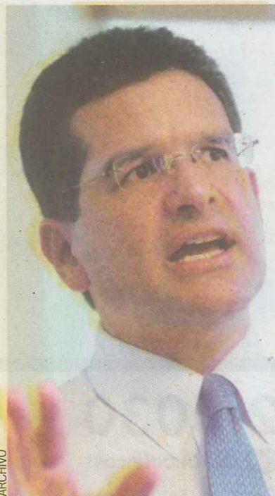
El comisionado Pedro Pierluisi,

La ley permanente establece que el reembolso a Puerto Rico y las Islas Vírgenes estadounidenses alcanzará $10.50 por cada galón de ron importado. Estados Unidos impone un arbitrio de $13.50 por cada galón de