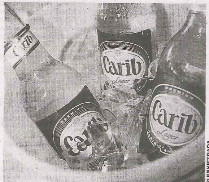
Carib ha sido galardonada con premios tales como: Monde Selection GOLD MEDAL 2002, World Beer Cup 2000 - Association of Brewers USA, GOLD y Monde Selection GOLD MEDAL 1989.

Según el Puerto Rico Internet Marketing Study realizado por la SME, actualmente en la Isla existen más de 1.3 millones de personas activas en las redes sociales. Esto representa un 61% del uso que se le da al Internet localmente. Es por esto que la marca se enfocará en una plataforma digital y cuenta con páginas en diversas redes sociales.