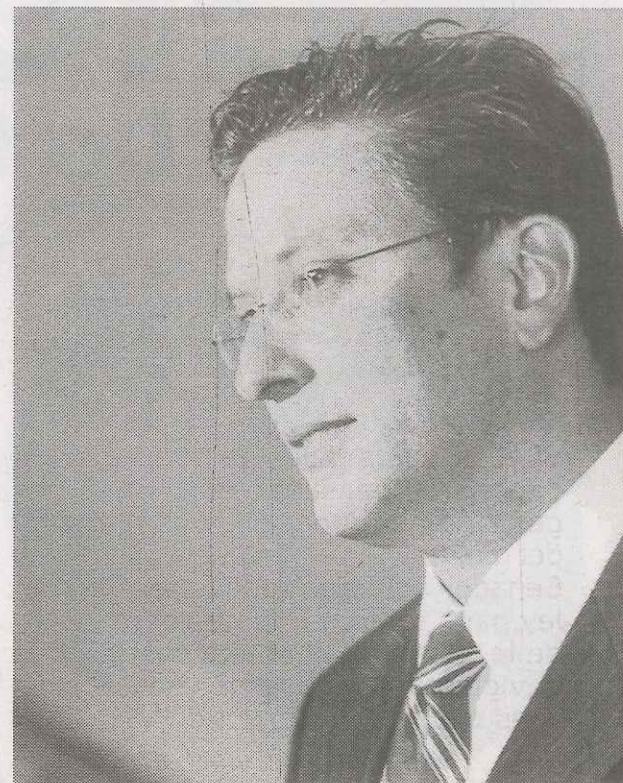
ALEJANDRO GARCÍA PADILLA