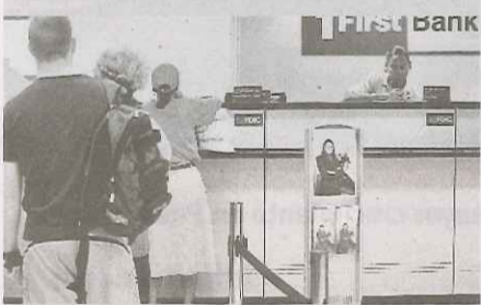
LA MATRIZ de FirstBank no pudo precisar cuándo radicaría el informe anual.

Esta semana, El Nuevo Día reveló que el importante grupo de inversión Carlyle analiza la posibilidad de adquirir parcial o totalmente las acciones de la institución, que lleva casi un año buscando unos $350 millones para recapitalizarse.