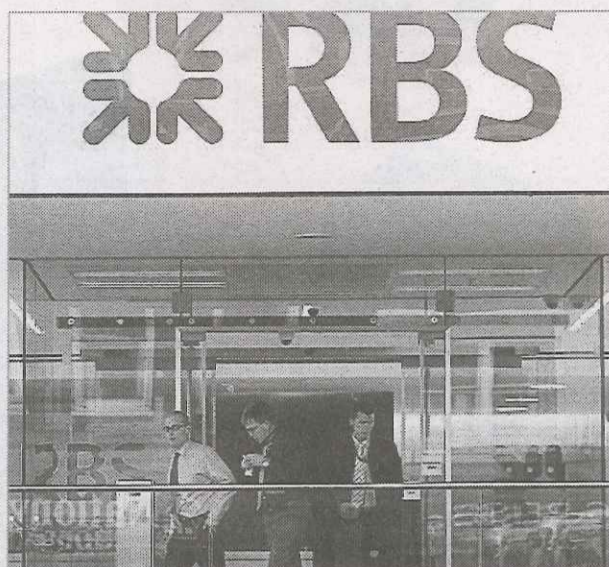
La entidad financiera The Royal Bank of Scotland (RBS), con amplia experiencia en financiamiento de infraestructura, es parte de la delegación del Reino Unido que está de visita en la Isla.