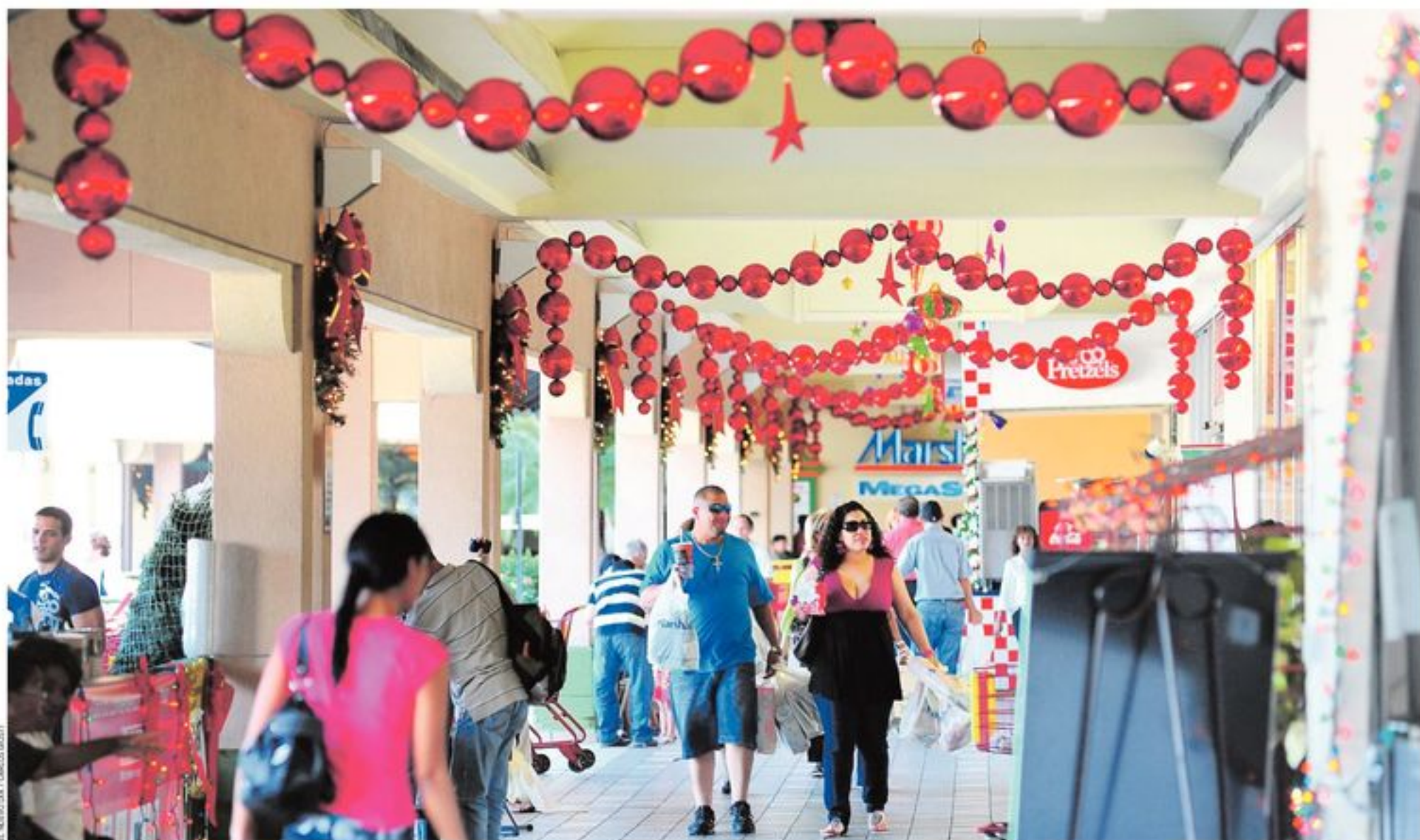
No todo fue negativo durante el 2009 para el comercio, durante este año varias empresas lograron iniciar procesos de expansión y nacieron nuevos negocios en la Isla.