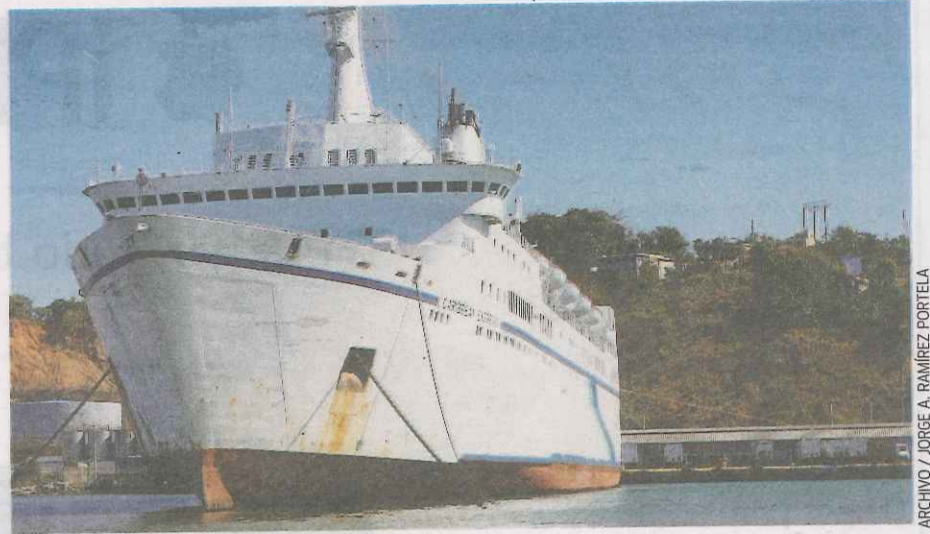
FERRIES DEL CARIBE cesó el servicio para pasajeros en Puerto Rico el 16 de abril.

Galardonado por cuarto año consecutivo por la Agencia de Protección Ambiental y por el Departamento de Energía. *Comparada con una lavadora convencional fabricada antes del 2004.