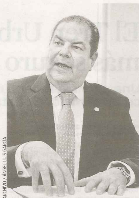
ARCHIVO / ÁNGEL LUIS GARCÍA

Esa propuesta -presentada esta semana por el comisionado residente Pedro Pierluisi en el Congreso- busca que las corporaciones que generen al menos el 50% de sus ingresos en Puerto Rico se les trate como empresas domésticas. De esa forma, esas empresas repatriarían ganancias a sus matrices